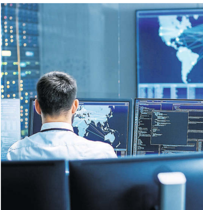
La cybersécurité mise à l'épreuve.