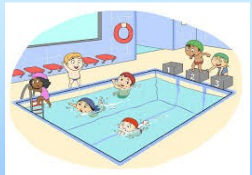
Les élèves de CP-CE1

Nous pouvons sauter du plongoir, nager avec une frite, faire du toboggan, chercher des anneaux sous l'eau, faire l'étoile, s'accrocher à la cage, tout en respectant certaines règles : ne pas courir, ne pas pousser, ne pas marcher trop près du bassin, ne pas faire mal.