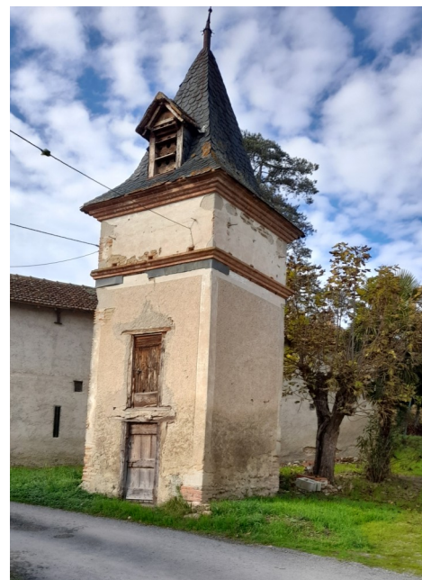
Pigeonnier à Busque

Je terminerai cette présentation par l'action menée depuis quatre ans par l'association des « Z'Elles Gaillacoises » regroupant 30 viticultrices qui durant deux jours animent une manifestation se terminant par une vente aux enchères de très bons crus de leur domaine dont la recette aide à sauvegarder un pigeonnier.