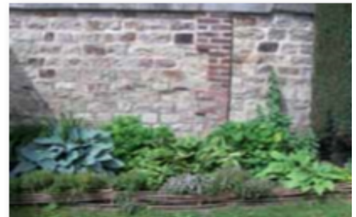
Massif sobre à Montigny-sur-Meuse