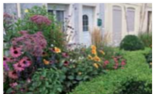
Massif mixte à Bogny-sur-Meuse

Ces principes peuvent être appliqués à l'échelle du jardin d'un particulier. Il est intéressant de sensibiliser les habitants à une possible coordination entre le fleurissement de leurs espaces privés et celui de la commune.