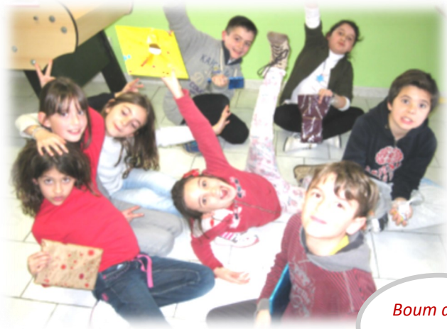
Boum de fin d'année