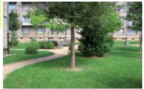
Espace herbacé à Revin

Mettons les bonnes idées en commun et nous arriverons à :