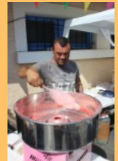
Kermesse — Juin 2015