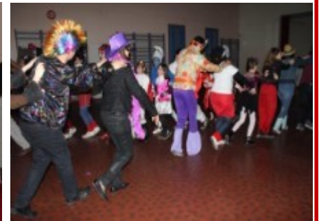
Soirée déguisée — Février 2015