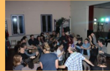
Après-midi et soirée de Noël 2014